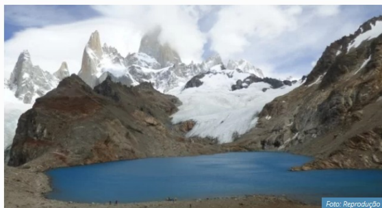
Monte Fitz Roy