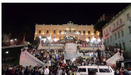
Protesto foi encerrado na frente do Palácio Anchieta, em Vitória

Os participantes começaram a se dispersar por volta das 21h.