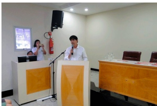
Prefeito Edson Magalhães.

O prefeito Edson Magalhães também marcou presença na solenidade e enfatizou a importância do investimento na educação e nos estudantes. "Vocês serão mediadores. Serão as pessoas que vão preparar o futuro para outras pessoas", concluiu.