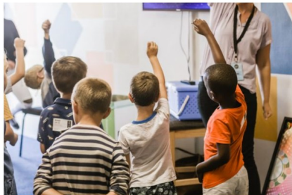
Sala de aula de alunos da educação infantil.

A Prefeitura de Vila Velha, por meio da Secretaria Municipal de Educação (Semed), não alterou o calendário escolar em consequência do coronavírus. A administração municipal seguirá todas as orientações e determinações do Ministério da Saúde e da Organização Mundial da Saúde em suas unidades de Ensino. Também foi enviada uma circular à direção de todas as 101 escolas municipais sobre os cuidados relativos à saúde dos alunos, profissionais de Educação, pais e responsáveis.