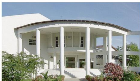
Unidade do Ifes de Cachoeiro de Itapemirim vai selecionar professor substituto da área de Matemática

Duas prefeituras, além do Instituto Federal do Espírito Santo (Ifes), abrem seleções para contratar profissionais de todos os níveis de escolaridade. As remunerações chegam a R$5.831, para trabalhar em Colatina, Ibraçu, Cachoeiro de Itapemirim e Linhares.