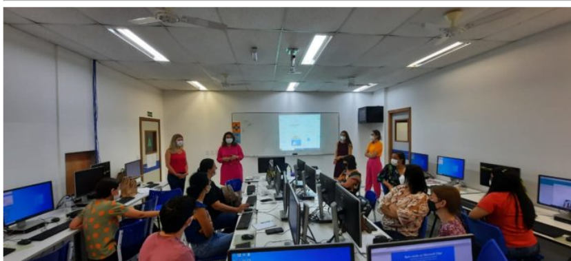
Professores da rede municipal do turno matutino acompanhados pela secretária municipal de educação, pela coordenadora do Ensino Fundamental na Seme, pela responsável pela Formação Continuada na Seme e pela professora do IFES