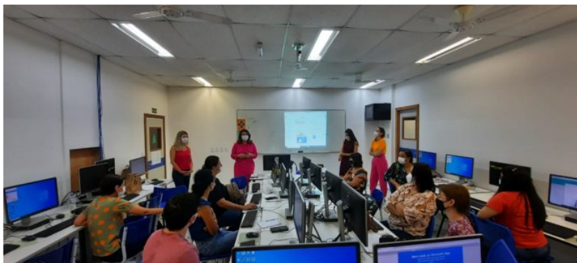
A secretária municipal de educação de Nova Venécia em encontro de formação com os professores de língua da rede e do IFES

A prefeitura de Nova Venécia, por meio da Secretaria Municipal de Educação (Seme), ofereceu, no dia 2, quinta-feira, em parceria com Instituto Federal do Espírito Santo (IFES) campus – Nova Venécia, um encontro entre os professores da rede municipal de educação para traçar o Plano de Intervenção Pedagógica (PIP) para as últimas semanas de aula, visando elencar todas as estratégias a fim de diminuir a defasagem apontada pela avaliação diagnóstica deste componente curricular. A formação aconteceu no Laboratório de informática – IFES Nova Venécia nos dois turnos.