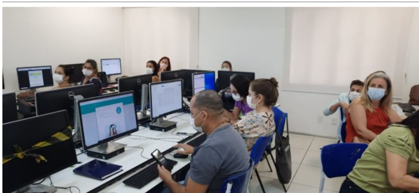
Professores de língua portuguesa da rede municipal do turno vespertino acompanhados dos supervisores escolares