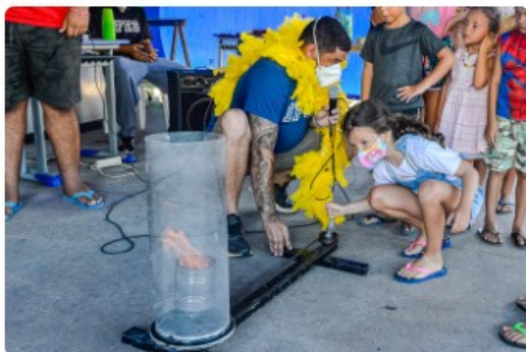
Show de Física na Praça da Ciência. 🔍