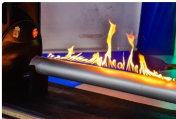
Show de Física na Praça da Ciência. 🔍

Sob os olhares atentos da criançada e de pais e responsáveis, os estudantes do curso de Física do Instituto Federal do Espírito Santo (Ifes), de Cariacica, apresentaram para a plateia um extenso leque de experiências, com conceitos de mecânica, termodinâmica e óptica, realizado na manhã desta sexta-feira (21), na Praça da Ciência. E o melhor disso tudo é que a participação do público foi essencial para o show acontecer.