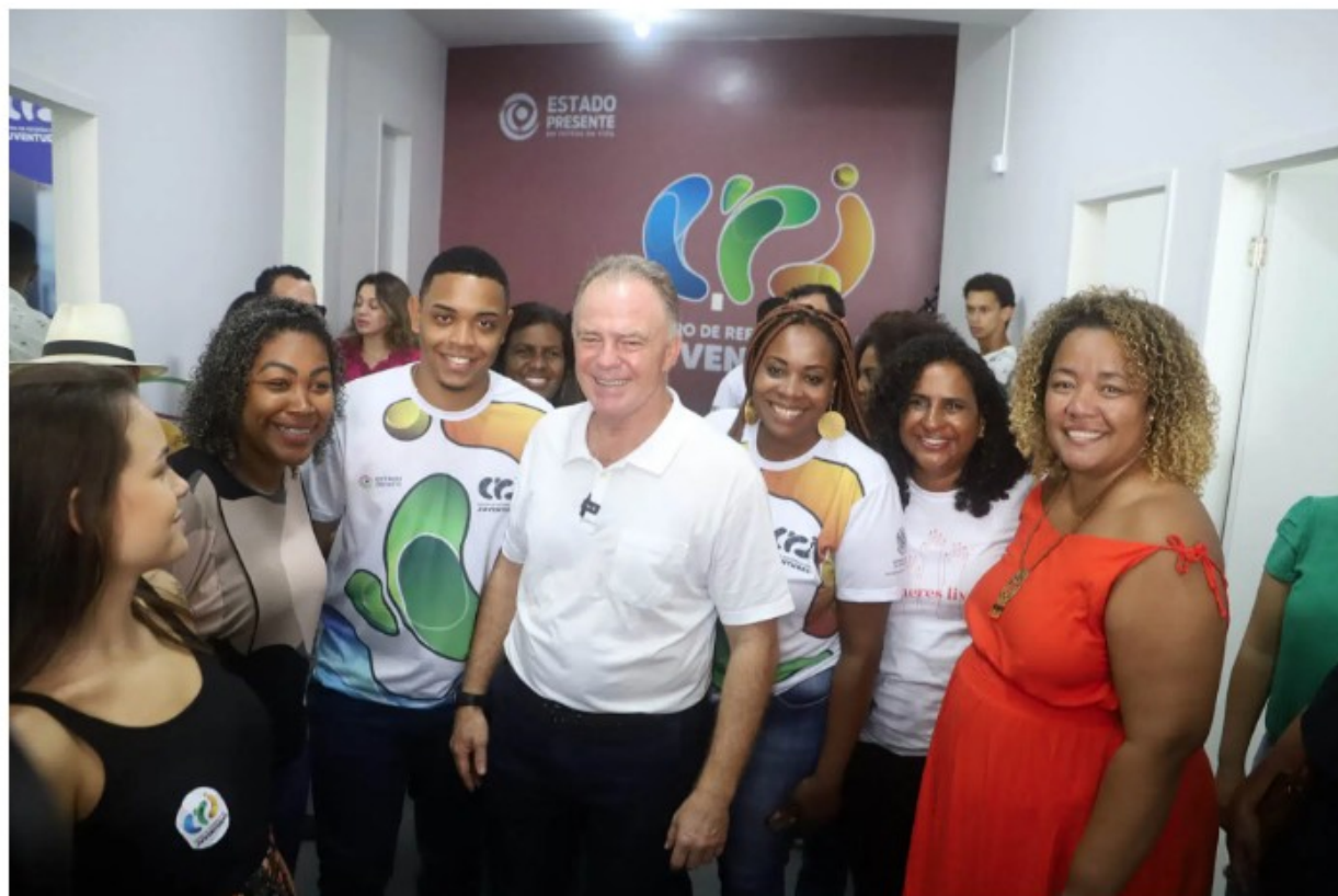
O governador do Estado, Renato Casagrande, inaugurou, na manhã desta segunda-feira (25), o Centro de Referência das Juventudes (CRJ) de Guarapari, no bairro Kubitschek.

“Queremos que a juventude seja protagonista! Por isso, as políticas públicas para esse público são fundamentais para nós. Estamos tencionando a juventude para o mundo das oportunidades. É o sexto CRJ que estamos inaugurando, movimentando toda essa juventude. Vamos ofertar cursos de formação e atividades culturais para que os jovens possam se encontrar, interagir e ver que existe caminho para o presente e futuro. Queremos que aqui seja um foco de oportunidades”, afirmou o governador.