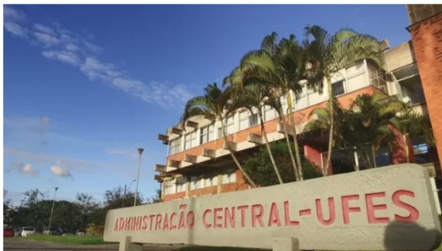
Universidade Federal do Espírito Santo (Ufes)

Juntos, a Universidade Federal do Espírito Santo (Ufes) e o Instituto Federal do Espírito Santo (Ifes) deixarão de receber R$ 31.510.196,00 em 2022 devido ao bloqueio de 14,5% da verba destinada às universidades federais, feito na última sexta-feira (27) pelo Ministério da Educação .