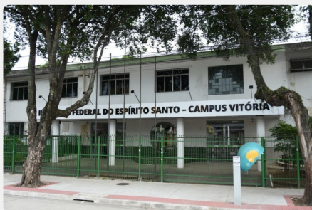
Ifes de Vitória: concurso aberto para novos servidores

O Instituto Federal do Espírito Santo publicou dois editais para concurso público para contratar novos professores, técnicos e outros servidores. No total, são 48 vagas abertas e o salário inicial é de até R$ 4.556,92, além de benefícios.