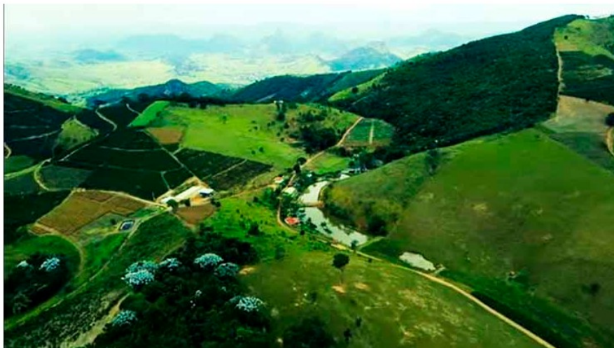
Abertas as inscrições para o 1º Seminário de Inovação e Tecnologia de Cafés em Alto Rio Novo

Os interessados poderão fazer as inscrições pela internet até o dia 8 de março