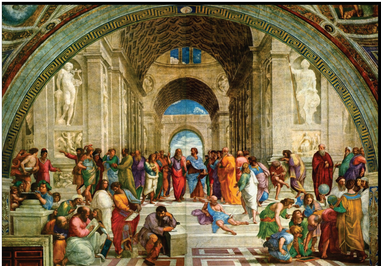
Detalhe do afresco A escola de Atenas .

No centro da imagem, o filósofo Platão é retratado apontando para o alto. Esse gesto retratado no afresco de Michelangelo faz referência ao Mundo das ideias de Platão. Com relação ao Mundo das ideias, assinale a alternativa que melhor corresponde ao pensamento platônico: