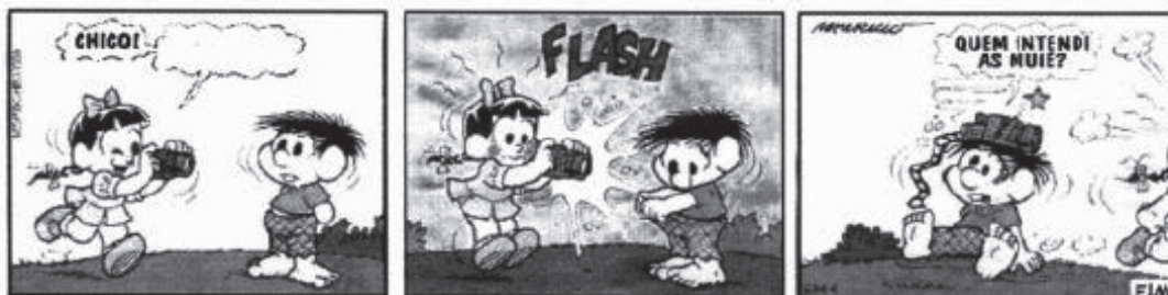
(SOUZA, Maurício de. Chico Bento . Rio de Janeiro: Ed. Globo, nº 335, Nov. /99)

Em uma conversa ou leitura de um texto, corre-se o risco de atribuir um significado inadequado a um termo ou expressão, e isso pode levar a certos resultados inesperados, como se vê nos quadrinhos abaixo.