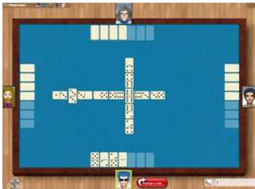
Figura 03: simulação de jogo em “andamento”

16. Na situação simulada no tabuleiro da figura 03, dada a seguir, quatro pessoas estão jogando entre si, individualmente. Salazar é o jogador indicado pelo personagem de óculos na parte inferior desta figura, e suas pedras estão visíveis a você. Doze peças com naipes desconhecidos estão distribuídas entre os demais jogadores.