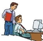
Pesquisadores e Estudantes